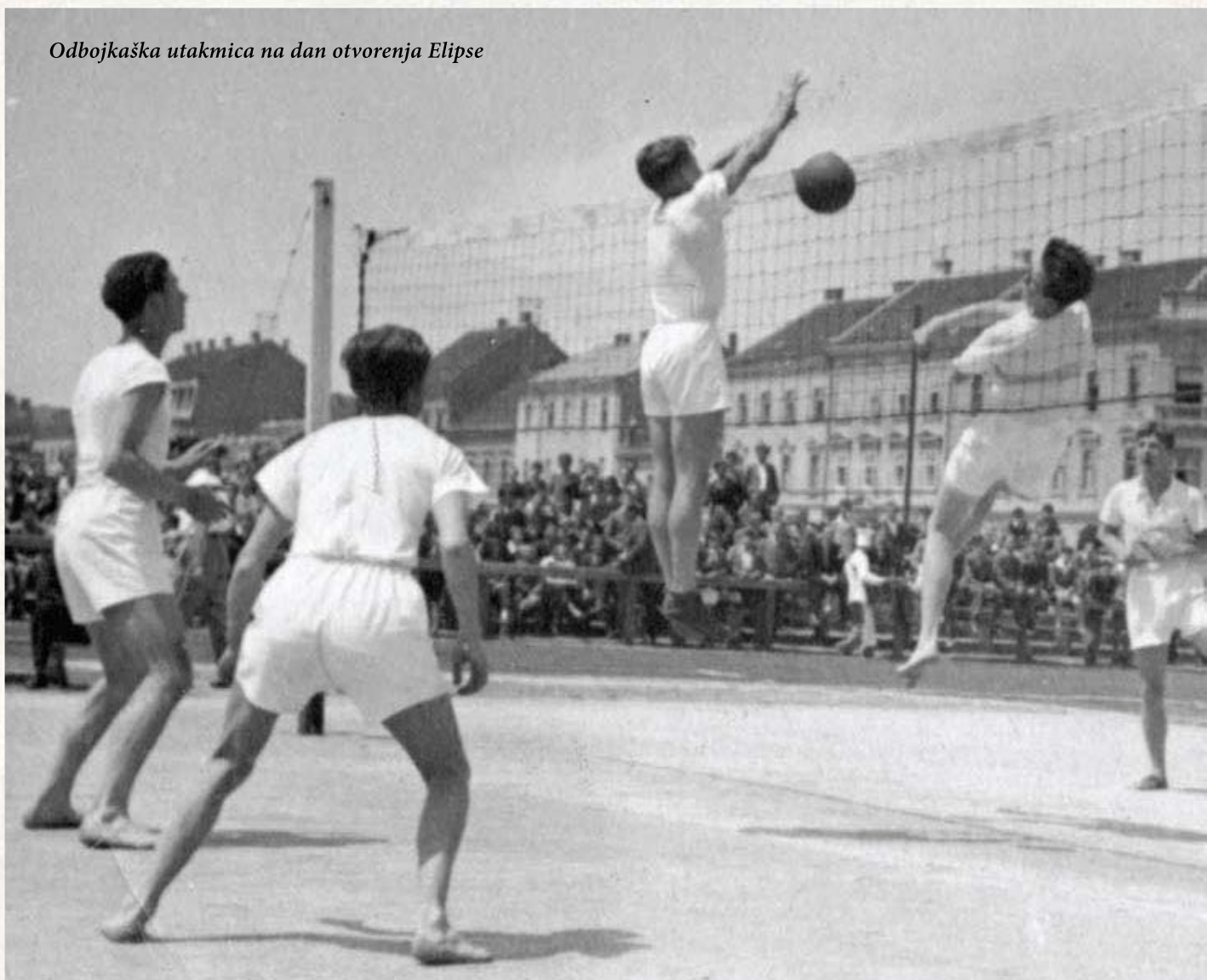
Odbojkaška utakmica na dan otvorenja Elipse

U svibnju prije 75 godina u Zagrebu je otvoreno Srednjoškolsko igralište, negdašnja Elipsa. Ono je predstavljalo jedino ograđeno i športu namijenjeno zemljište u Zagrebu na kojem se svakodnevno održavala nastava tjelesne i zdravstvene kulture osnovnih i srednjih škola, uz održavanje različitih tečajeva, treninga i utakmica.